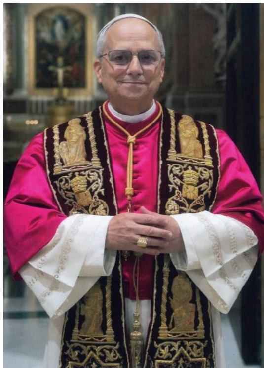
Leone PP. XIV. 8 maggio 2025